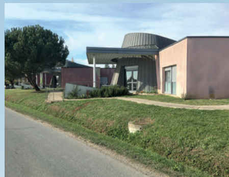
L'implantation de l'ESSOR