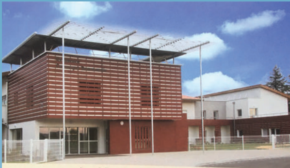
La construction de l'EPHAD Comarque Beaumanoir