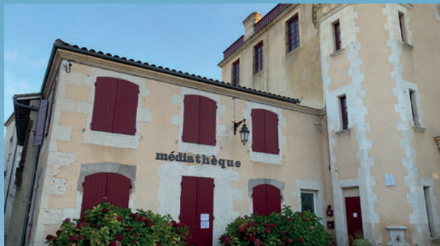
La création de la Médiathèque