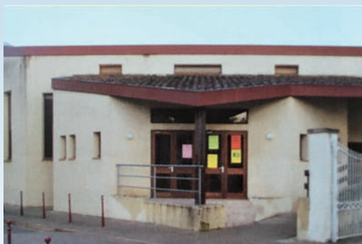
La création de la salle des fêtes Tivoli, remaniée en 2011