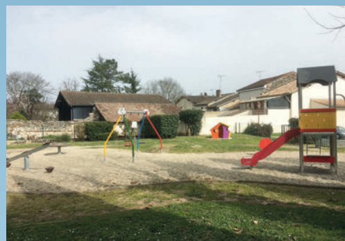
La création de l'Aire de jeux (Place Bransoulié)