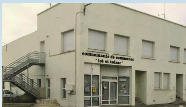
La création de la communauté de Communes (Décembre 1996)