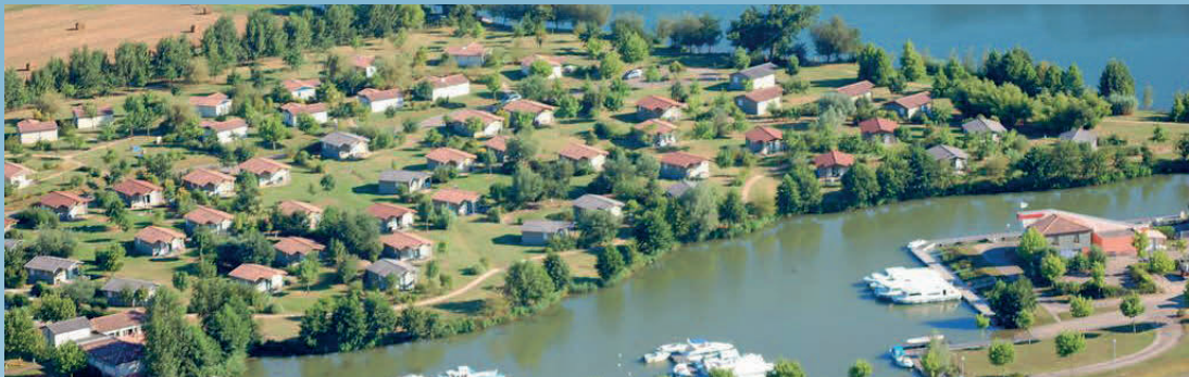
La construction du village de vacances (60 chalets)