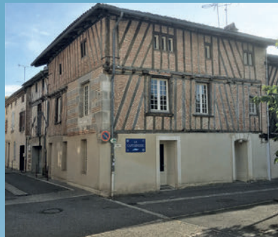
La création de la Capitainerie