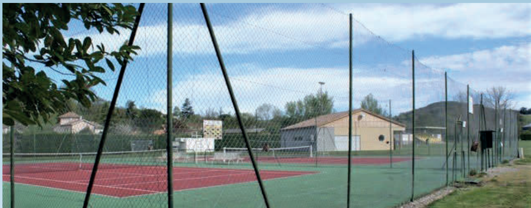
La création de courts de Tennis extérieurs