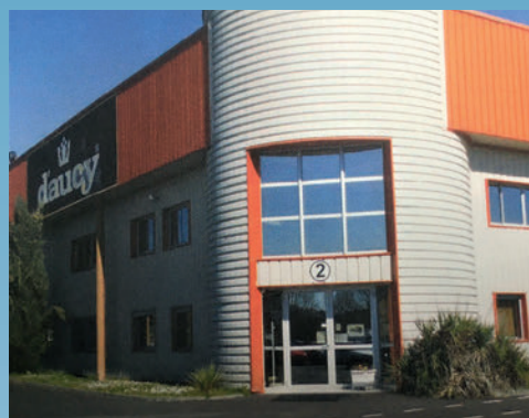
L'implantation de la conserverie DEPENNE-D'AUCY