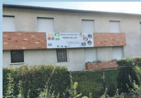
L'implantation de la MFR (Vallée du Lot) (Auparavant ancienne Maison de Retraite)