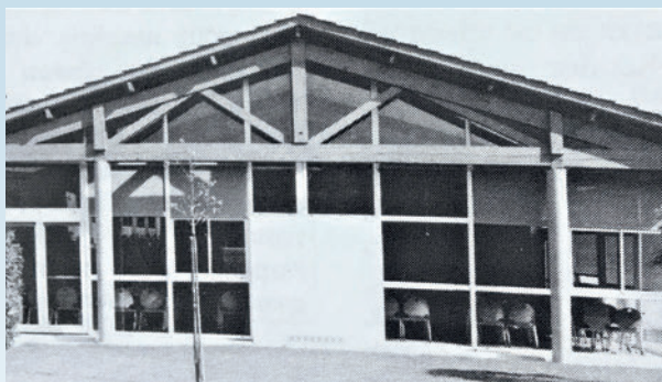
La construction du self-collège