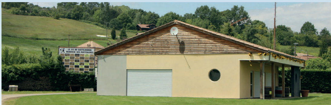
La construction du club house de rugby