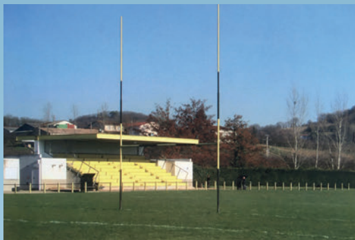
La construction du Stade de Rugby et des tribunes