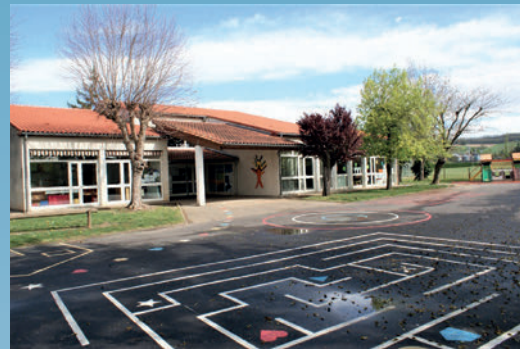
La construction de l'école maternelle