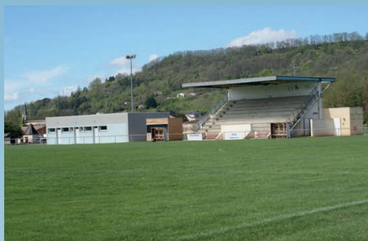
La construction du stade de football et des tribunes