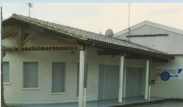
La construction du club house pétanque