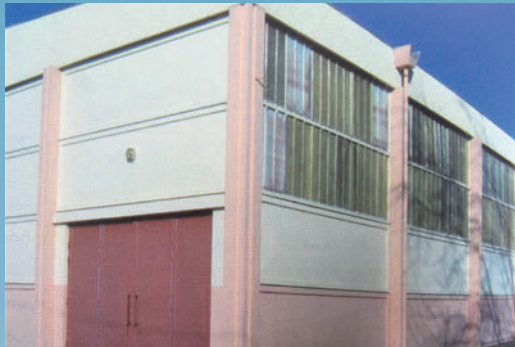
La construction du Stadium