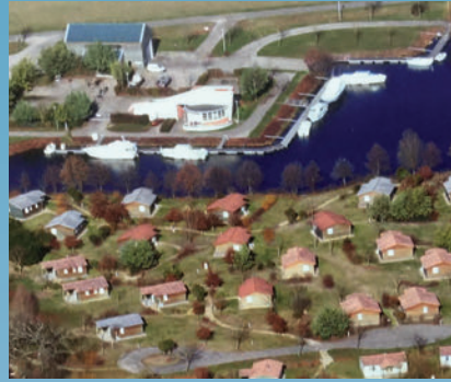
La construction du Port Lalande