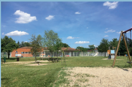
La création de l'Aire de jeux (devant la crèche)