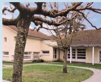
La construction de la crèche