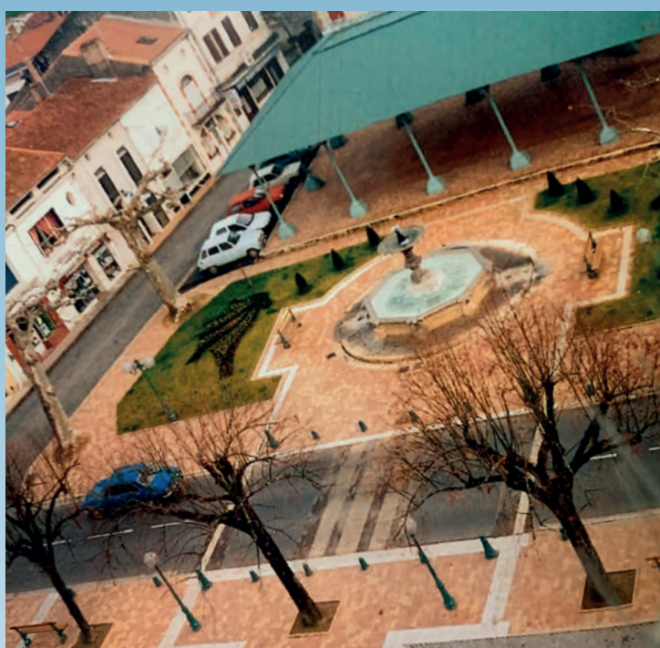
L'aménagement du centre bourg