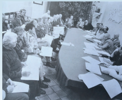
La 1 ère Réunion des élus communautaires (dans la Salle du Conseil Municipal)