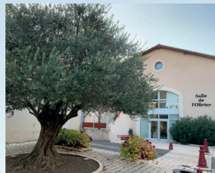
La construction de la salle de l'Olivier