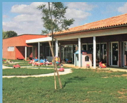
La construction de la Nouvelle crèche «Nuage Rose»