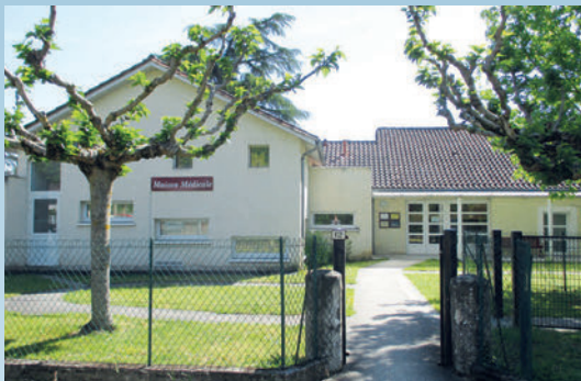
La création de la maison médicale (Auparavant ancienne crèche)